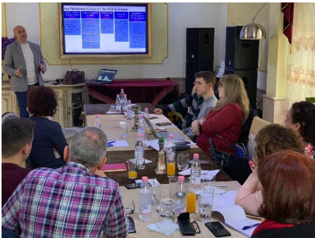
Figura 2: Nga prezantimi i opsioneve të vendosjes

Prezantimi kryesor u dorëzua megjithëse një format interaktiv dhe pjesëmarrësit u ftuan të angazhohen me vlerësimet në PRO dhe KUNDRA për secilën nga opsionet e paraqitura të vendosjes.