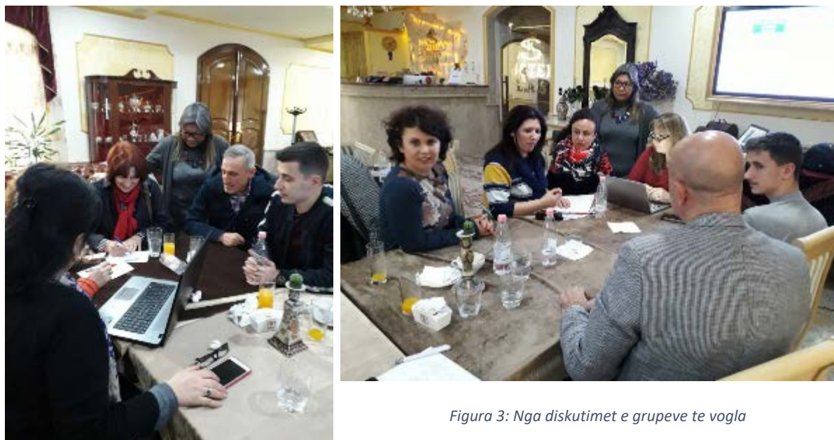
Figura 3: Nga diskutimet e grupeve te vogla

Diskutimi në grupet e vogla ishte i gjallë dhe tërheqës. Pas arritjes së konkluzioneve brenda grupeve, secili grup emëroi një reporter për të paraqitur rekomandimet në CCM.