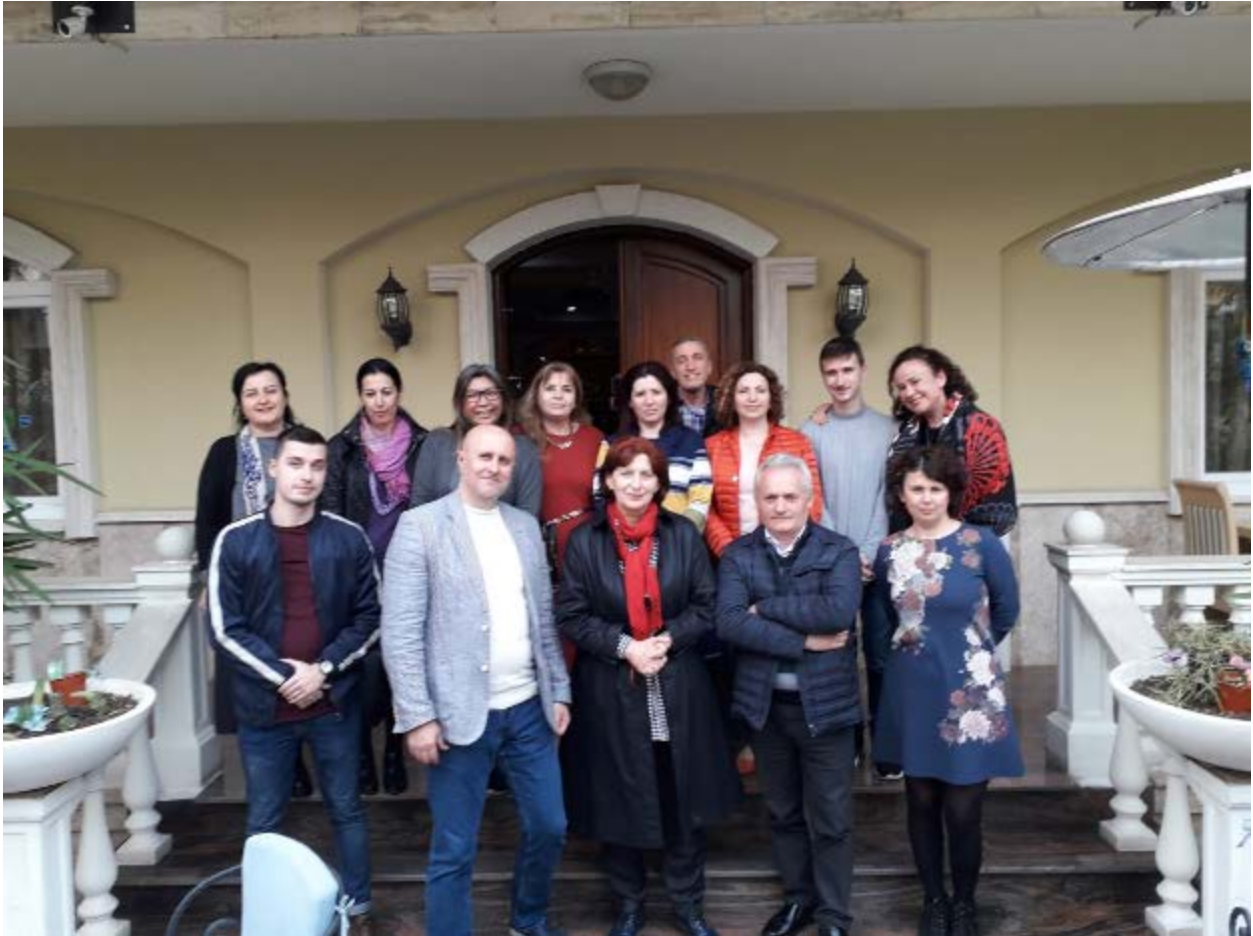
Figura 5: Foto ne grup e pjesemarrësve te workshop